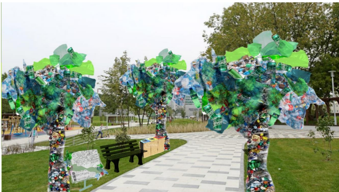
Рис1. 2D макет экопарка «Будущее которое мы создаем»

Контраст между общим внешним видом «деревьев» и деталями, из которых они состоят, наводит человека на мысль о незаменимости и важности настоящей и здоровой природы (рис 1.).